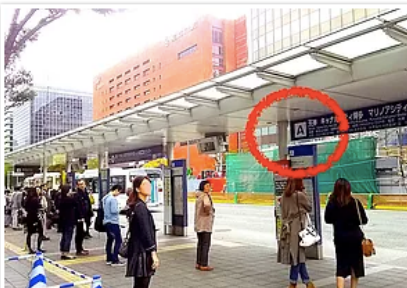
2) 大通り駅側の「博多駅前A」のバス停へ。左向こうオレンジ色のビル（西日本シティ銀行）が目印。5分ごとに来る47または48番のバスに乗車