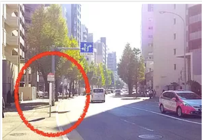
4) 「美野島1丁目」バス停で下車、周りに目立つ目印がないので注意