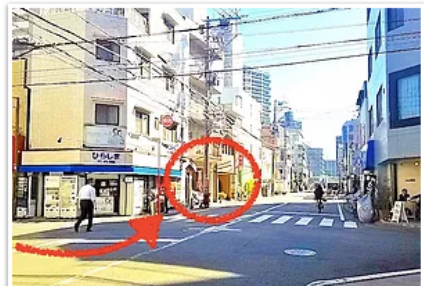
6) 一つ目の交差点を左折すると2軒目の建物がTOKI！