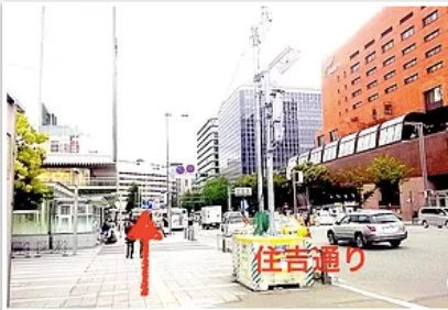
2) 正面に「西日本シティ銀行」、横断歩道を渡らずに左へ直進