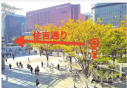
1) 博多駅博多口を出て、正面の大通り（住吉通り）へ ※地下鉄でお越しの場合は博多改札口の西13番（階段）か西15番（エレベーター）出口より地上へ