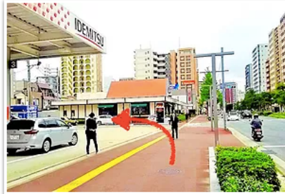
4) 5分ほど歩くと出光（ガソリンスタンド）とロイヤルホストが見えるのでその間の道を左折、反対（右）には住吉神社のT字交差点