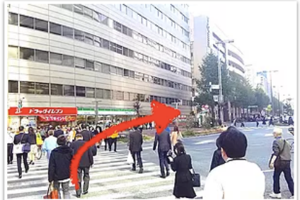
3) KITTEを通り過ぎ3分ほど歩くとドラッグイレブンが見えるので右方向へ直進