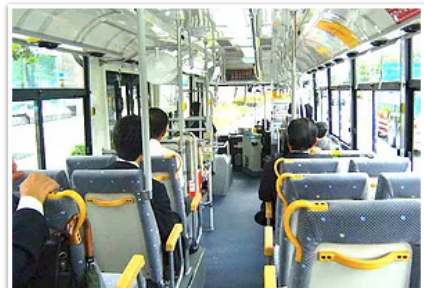
3) TOKI最寄りのバス停は「美野島1丁目」、3つ目のバス停で所用時間は6分程度