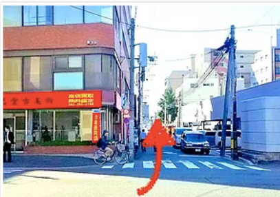
5) 通りを渡って、赤い看板の中国雑貨店横…道を直進