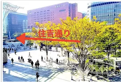
1) 博多駅博多口を出て、正面の大通り（住吉通り）へ ※地下鉄でお越しの場合は博多改札口の西13番（階段）か西15番（エレベーター）出口より地上へ

※Google Mapでは別のルートが表示されることもありますが、下記のルートが一番わかりやすく最短距離です。